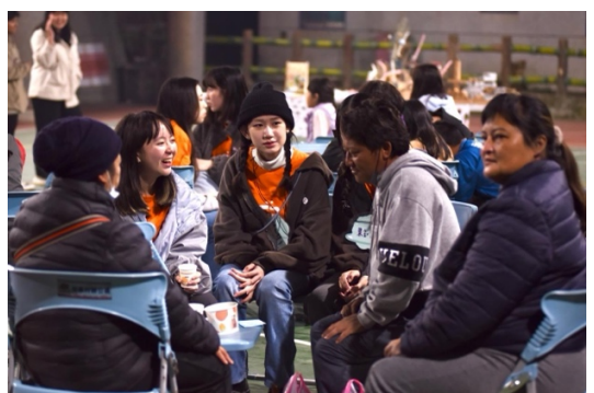
利用晚會時間與村民近距離交流 ，了解村民日常