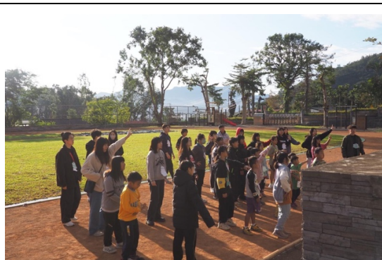
早操時間， 用輕快活潑的舞蹈開啟充滿活力的一天