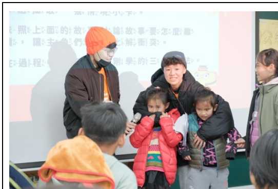
於情緒課中邀請小朋友上台分享， 在特定情境下會怎麼化解遇到的衝突