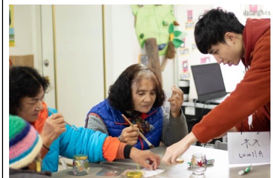
至部落中的文化健康中心帶領長者 一起彩繪裝飾瓶子