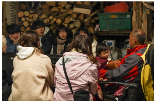
至學校的主任家中作客， 交流對於部落教育的想法及願景