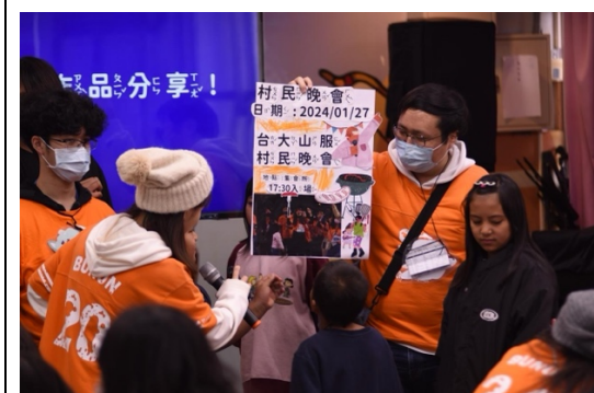
結合廣告設計課， 帶領小朋友設計村民晚會的宣傳海報